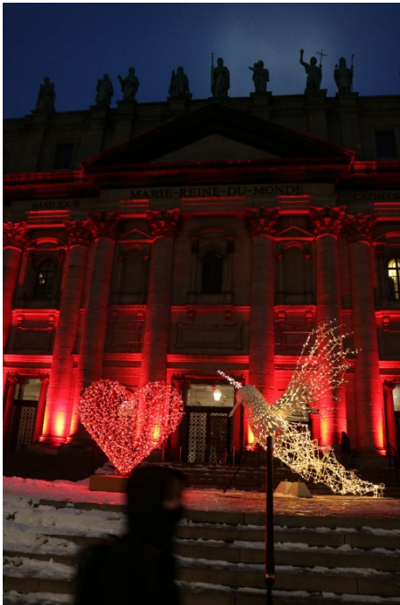
Photo : Montréal, 19 novembre 2025 – La cathédrale Marie-Reine-du-Monde illuminée en rouge à l'occasion du Mercredi Rouge.